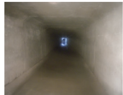
ボックスカルバート内部