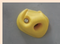
ホールド (ボルト M10)