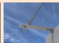
介助ロープ 取り付け治具