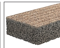
グランパムアート