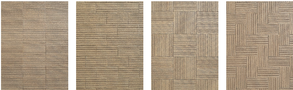
イモ張り ブリック パーケット フィッシュボーン