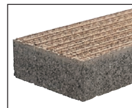
クリエイトアート

アートスルーの標準品となる『クリエイトアート』、水たまりを作らない透水機能を備えた『グランパムアート』、ヒートアイランド現象を抑制する保水性能をもった『ILTアート』の3種類をラインナップしています。